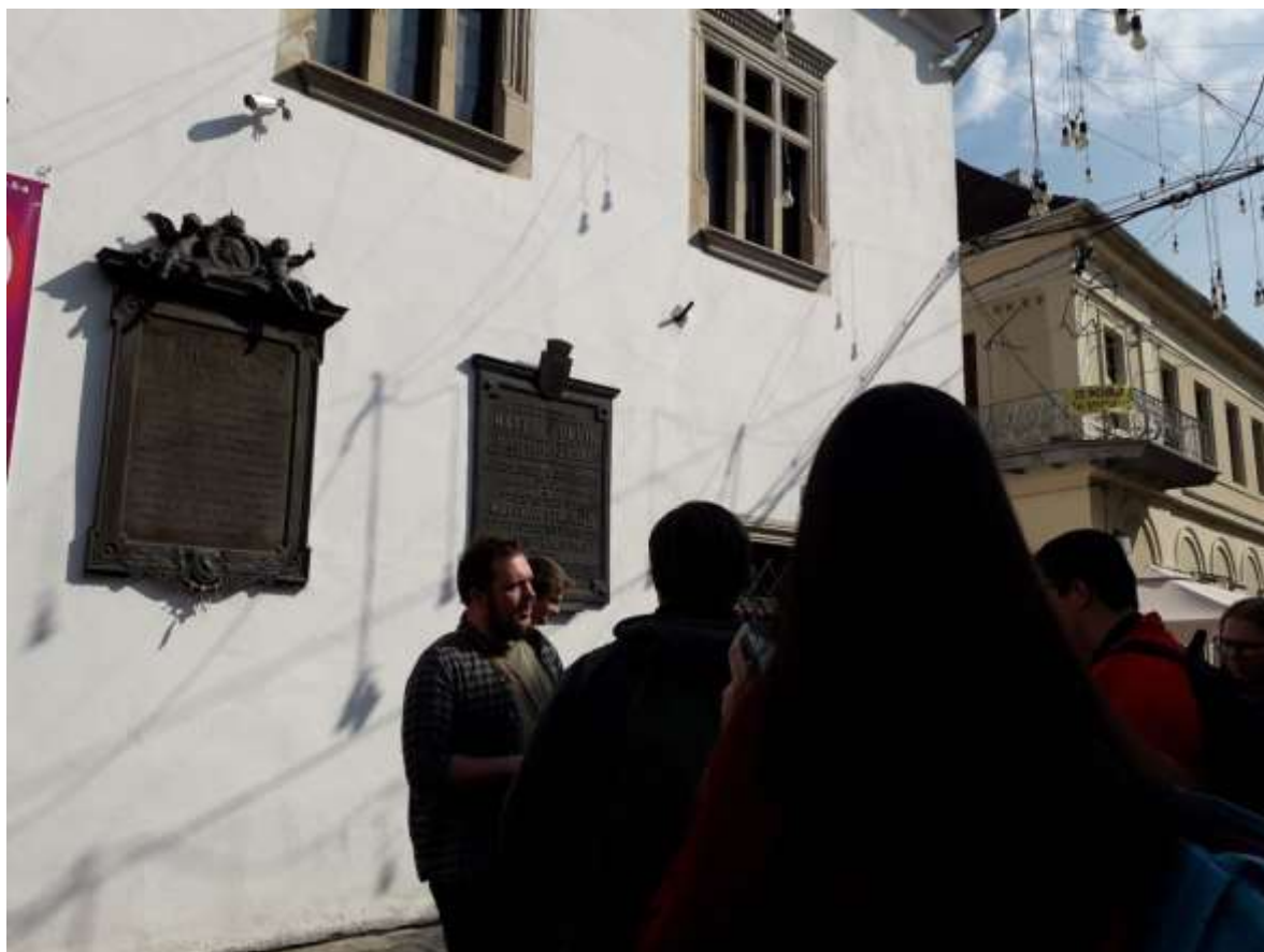
Mátyás király szülőháza, Kolozsvár