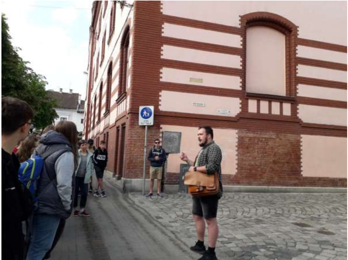
A régi városfalnál, Kolozsvár