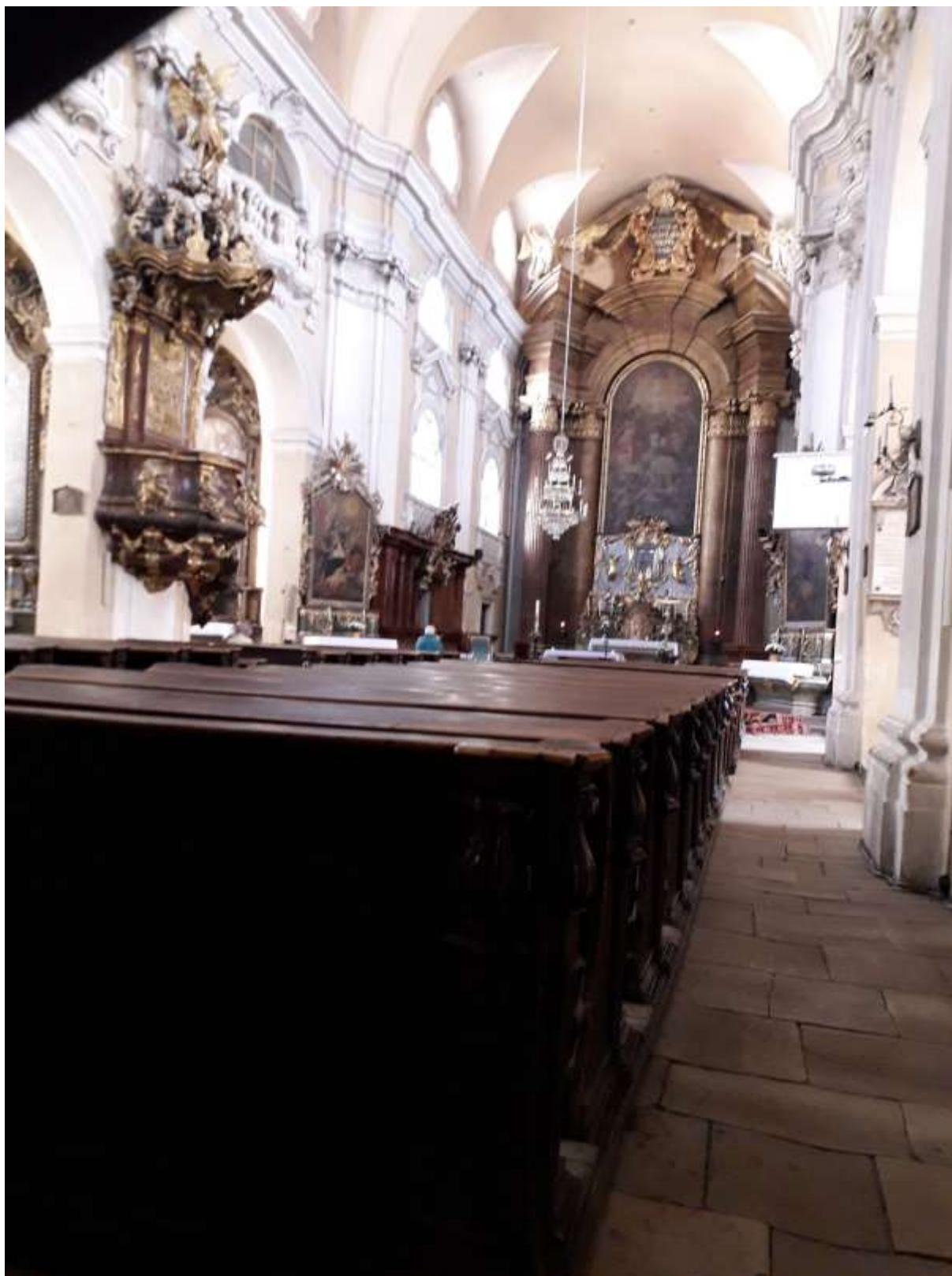
Piarista templom - templombelső, Kolozsvár