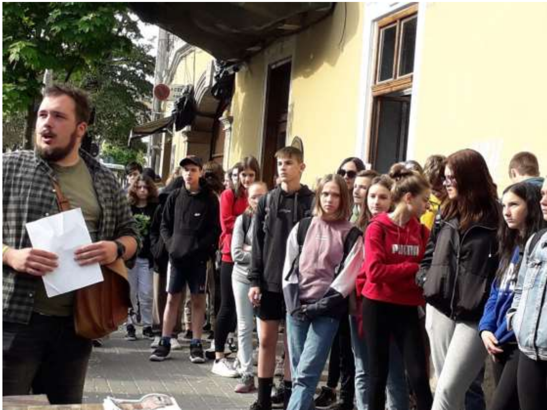
A Piarista templomnál, Kolozsvár