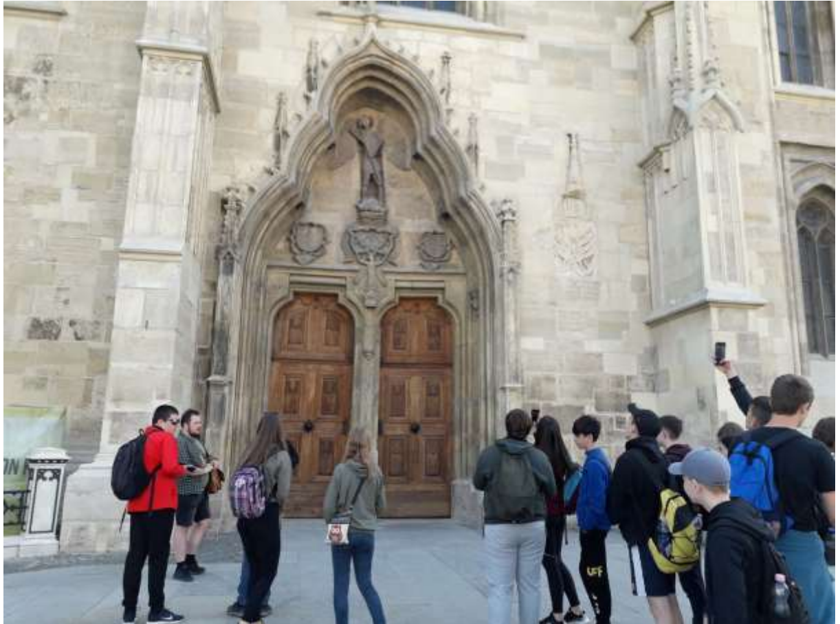
Szent Mihály templom főbejárata, Kolozsvár