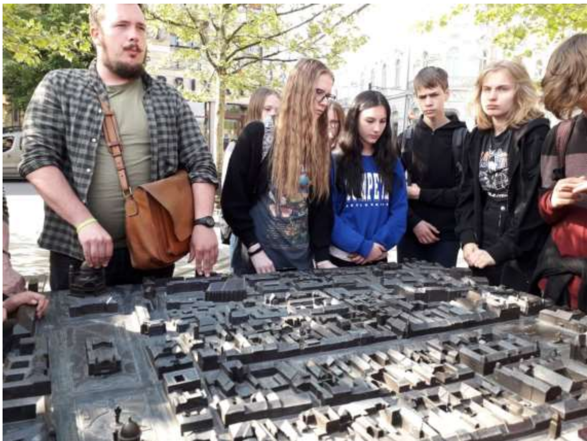
Város makett a Főtérről, Kolozsvár