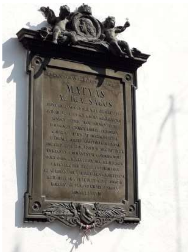
Mátyás király emléktáblája a szülőház falán, Kolozsvár