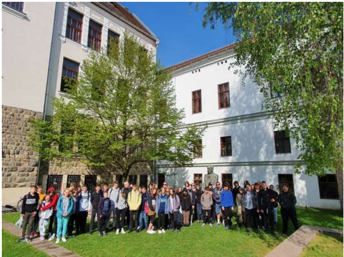
Református főgimnázium épülete, Székelyudvarhely