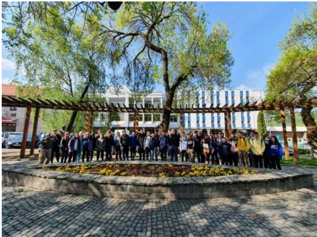
Történelmi szoborpark, Székelyudvarhely