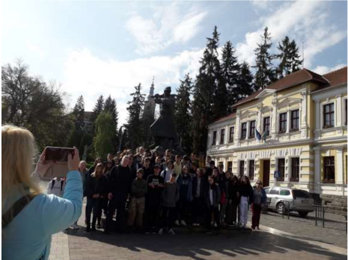
A Vasszékely, Székelyudvarhely