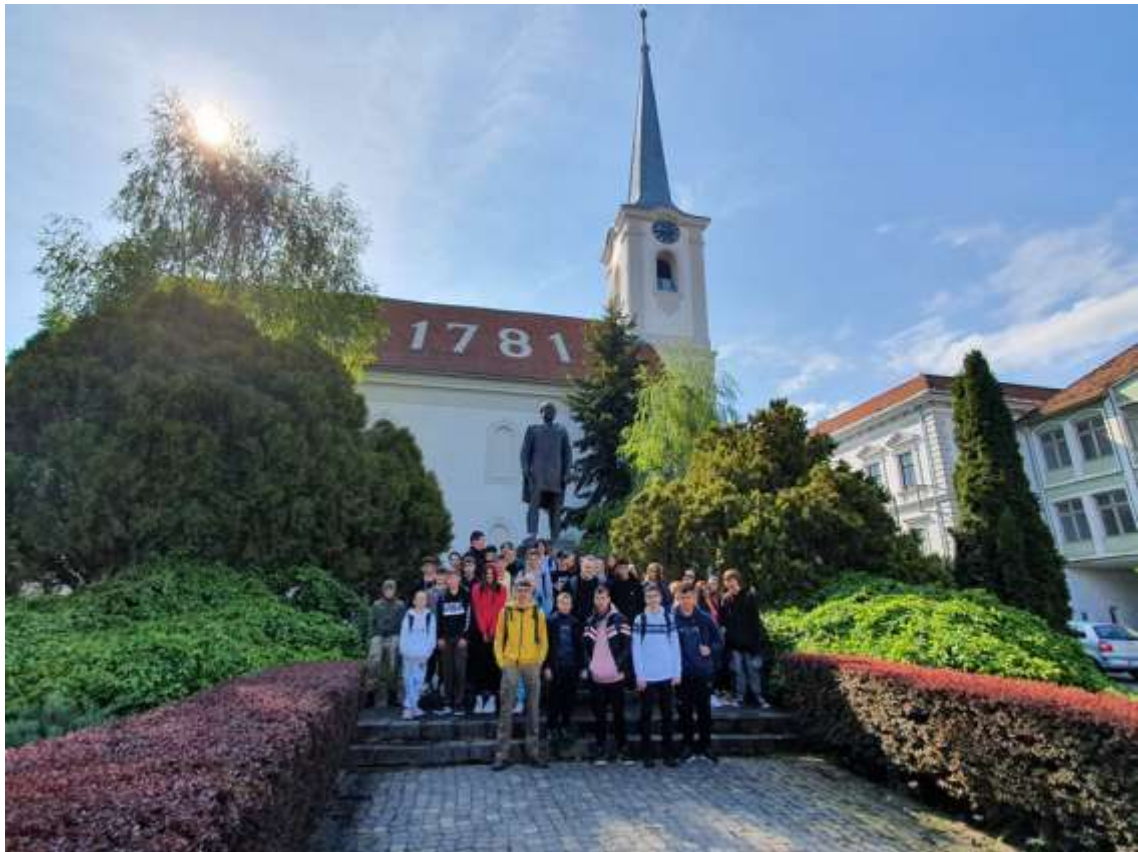
Református templom és Orbán Balázs szobra, Székelyudvarhely